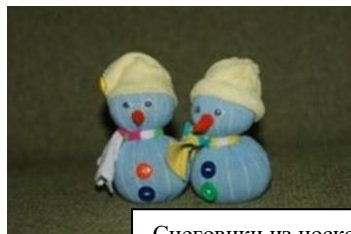
Снеговвики из носков